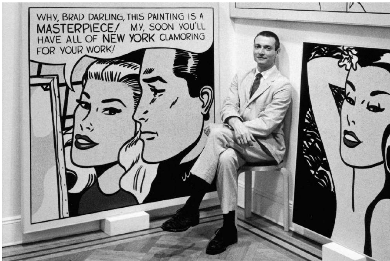
Roy Lichtenstein (1923 – 1997)

https://www.tate.org.uk/search?type=artwork&q=Roy+Lichtenstein