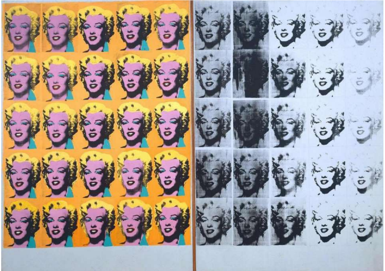
Andy Warhol »Diptych Marilyn« (1962), akril na platnu, 205 x 144 cm Vec slik: https://www.tate.org.uk/search?type=artwork&q=andy+warhol