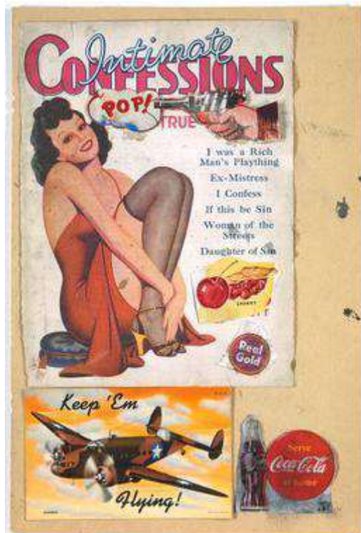
Eduardo Paolozzi » I was a Rich Man's Plaything «, kolaž. Več slik: https://www.tate.org.uk/search?q=eduardo+paolozzi

Londonski umetniki so si zadali nalogo preučevanja psihološkega vpliva masovne kulture , njen smisel in vsebino. Privlačili so jih tehnika kolaža in metode tiska reklam.