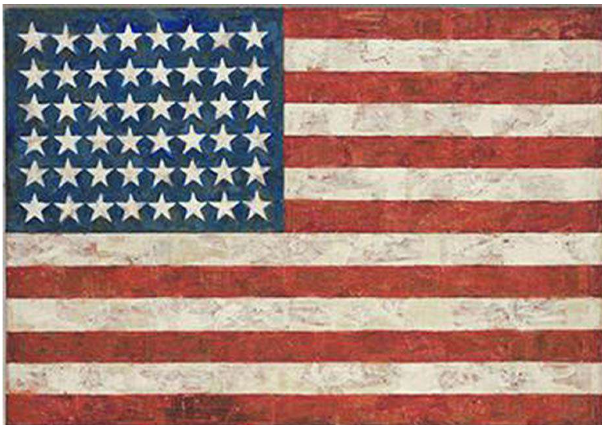
Jasper Johns »Flag« (1954) kolaž, olje, vosek na platnu, 107 x 153 cm https://www.tate.org.uk/search?q=jasper+johns