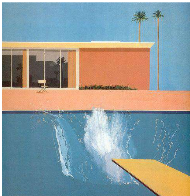
David Hockney »A Bigger Splash« (1967), akril na platnu, 94 x 94 cm http://www.hockney.com/works/paintings/60s