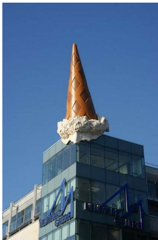
Claes Oldenburg »Dropped Cone« (2001), Neumarkt Galerie, Cologne, Germany

https://www.tate.org.uk/search?type=artwork&q=Roy+Lichtenstein